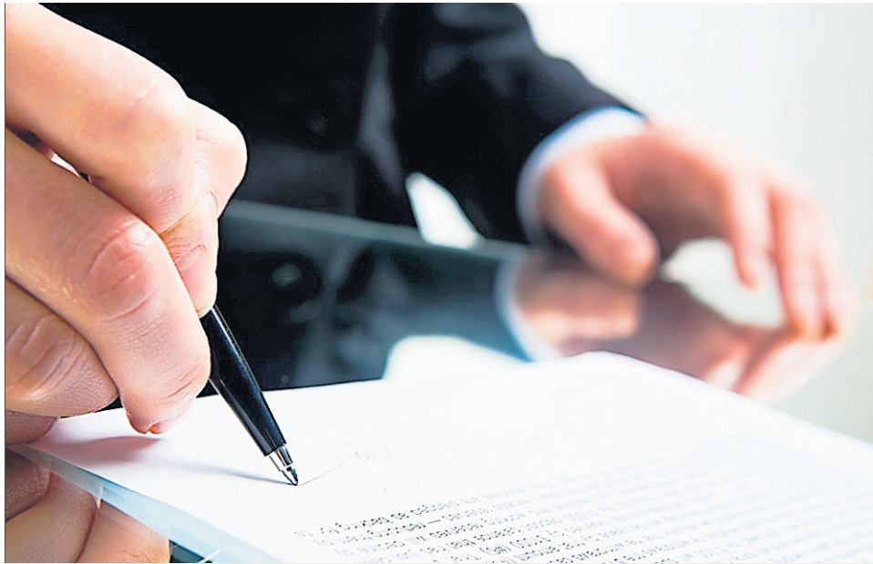
BEURKUNDUNG Bei hohem Vertragswert sollen die Tarife generell günstiger werden.

Der Gewerbeverband beklagt, die Tarife seien für die gewerbliche Wirtschaft zu hoch. Im Zeitalter «der elektronischen Verfügbarkeit aller Vertrags- und Dokumentenentwürfe» seien die vorgesehenen Gebührenansätze überhöht. Er fordert, «insbesondere die Promille-Sätze so zu senken, dass sie dem tatsächlichen Aufwand entsprechen». Die Notariatsgesellschaft ihrerseits legt Wert darauf, weiterhin einen Zwangstarif beizubehalten und klare Regelungen zu treffen, damit im ganzen Kanton vergleichbare Kosten verrechnet werden.