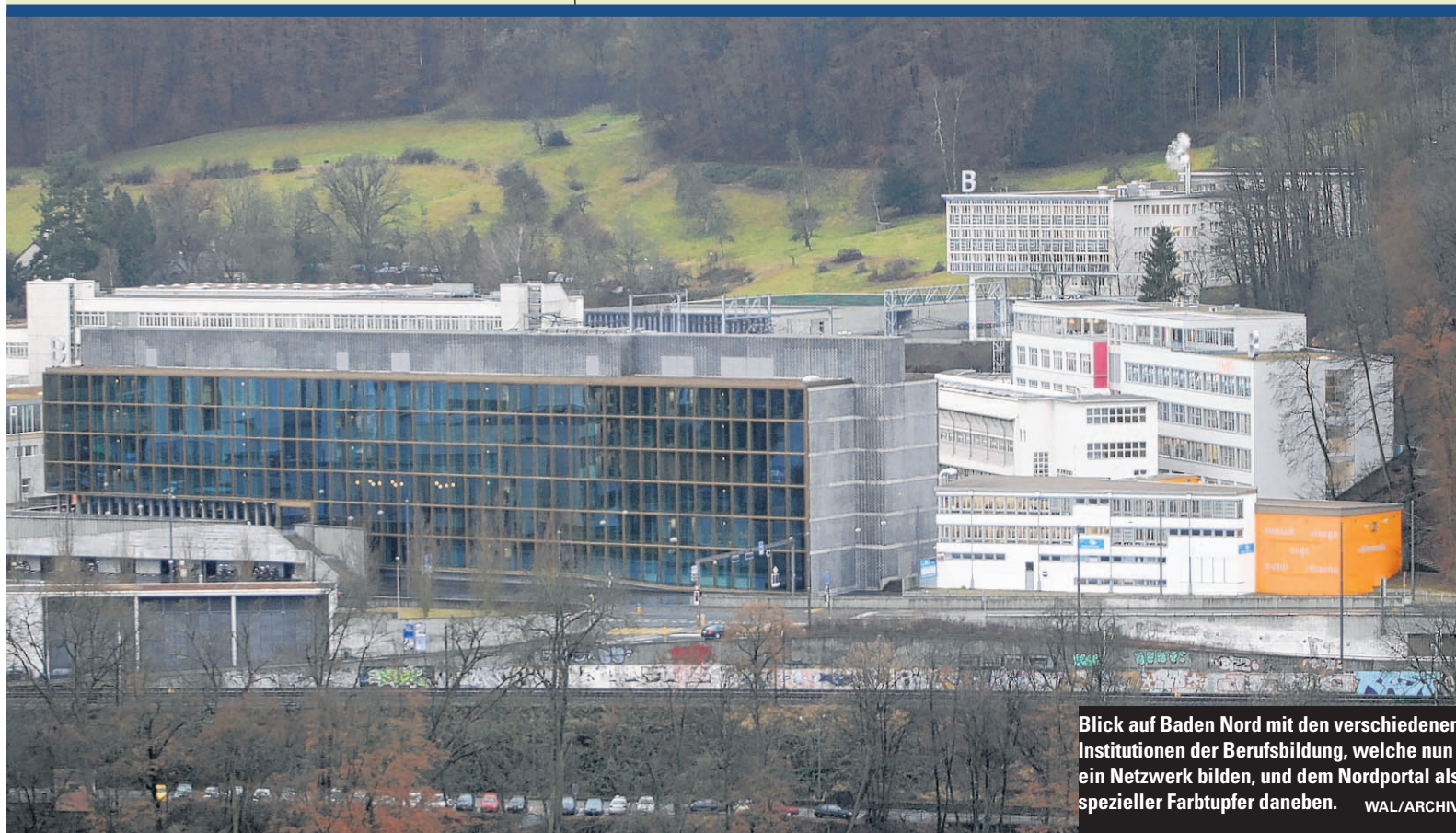
Blick auf Baden Nord mit den verschiedenen Institutionen der Berufsbildung, welche nun ein Netzwerk bilden, und dem Nordportal als spezieller Farbtupfer daneben.