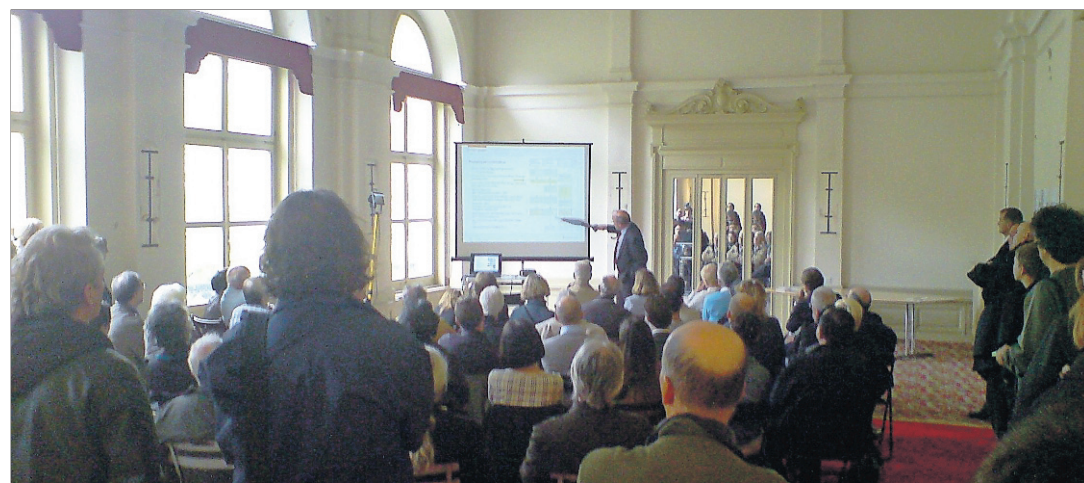
REGES INTERESSE Die Klappstühle reichten nicht für alle Versammlungsbesucher im «Verenahof».